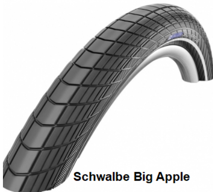
Schwalbe Big Apple

Existen en el mercado muchas más de distintas calidades y diseños que pueden satisfacer tus necesidades, ya que es muy importante ir con el neumático adecuado a cada superficie de rodadura, y solo tu sabrá decidir cuál es la mejor para tus recorridos.