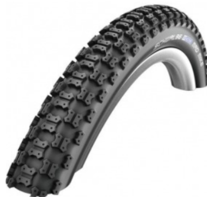
Schwalbe Mad Mike HS 137 16x2.125"